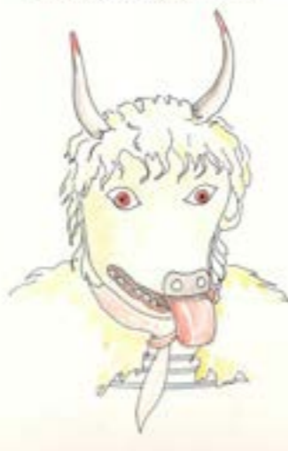
MASKA ZVONČARA IZ ITALIJE