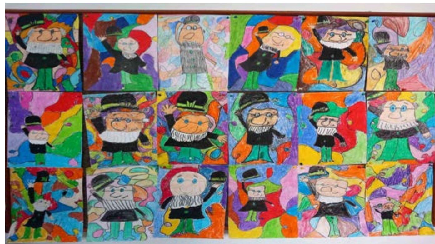
pano 4.a razreda