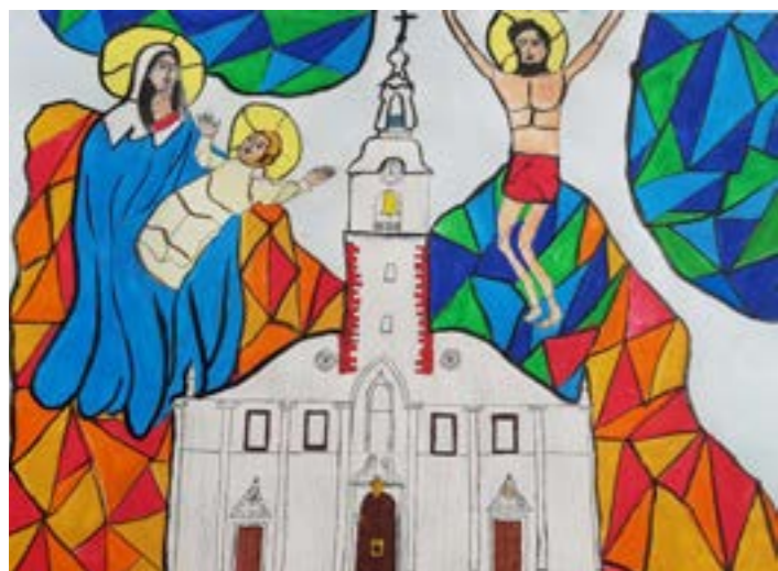
Christian Pros, 7.b