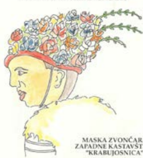
MASKA ZVONČARA ZAPADNE KASTAVŠTINE "KRABUJOSNICA"